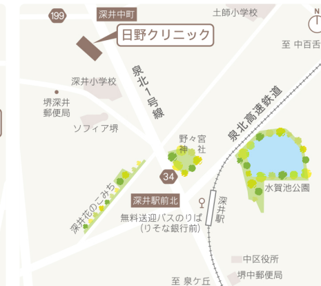
泉北高速鉄道「深井駅」より徒歩約10分 (無料送迎バスあり)