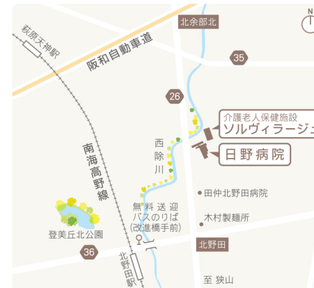
南海高野線「北野田駅」より徒歩約15分 (無料送迎バスあり)