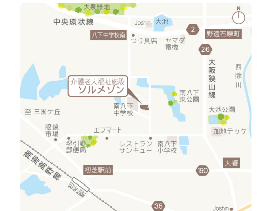
南海高野線「初芝駅」より徒歩約20分 (無料送迎バスあり)