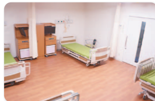
※写真はモデルルームを撮影したものです。