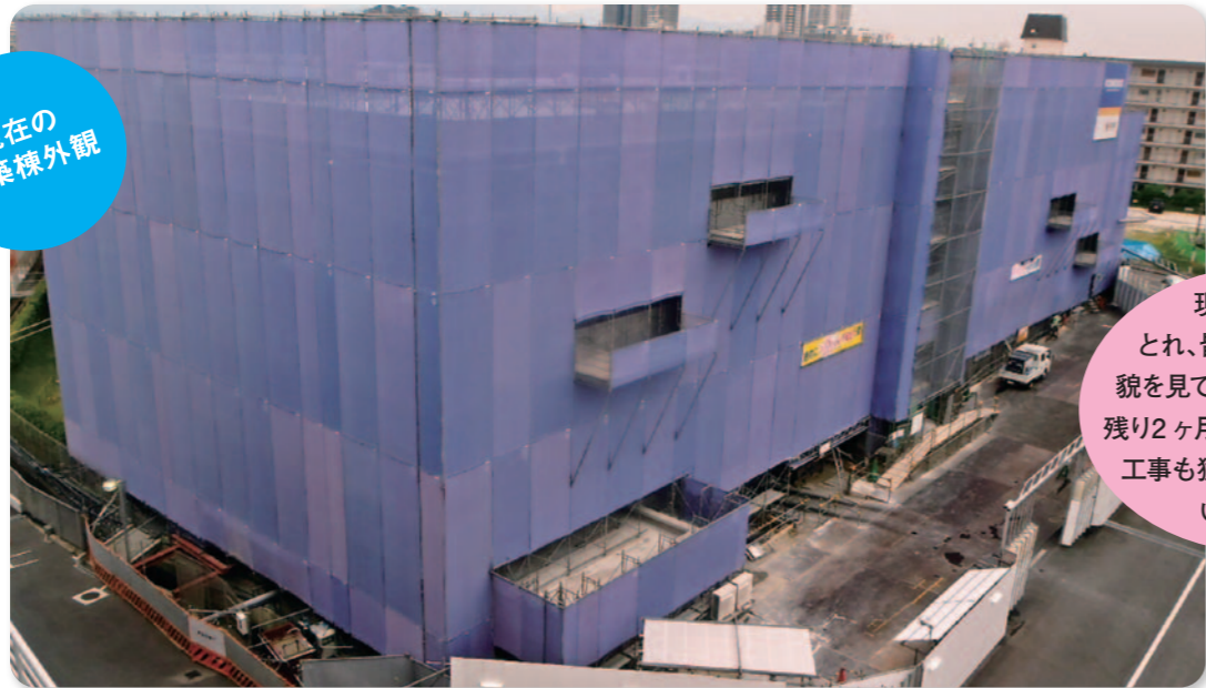
※写真は8月初旬撮影のものです。

現在は足場もとれ、皆さんに病院の全貌を見ていただいています。残り2ヶ月で、外構工事や内装工事も猛スピードで進んでいきますよ!