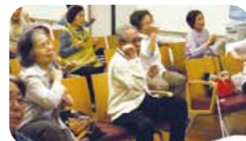
▲椅子に座ってエアロピクス!