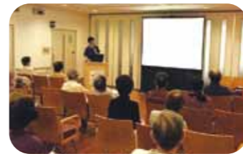
▲ソレイユの概要及び1年間の活動報告の様子