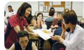
▲昼食&表彰式の様子

ここで、スタッフより皆さんにうれしいサプライズが! 1年間トレーニングに励まれたご利用者全員に表彰状が授与されました。